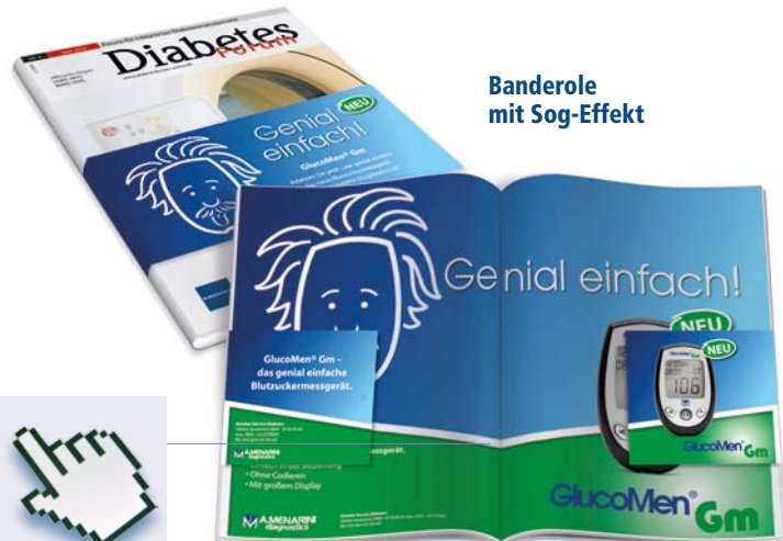
Banderole mit Sog-Effekt

Weitere Informationen zu Ad Specials finden Sie unter media.kirchheim-verlag.de/adspecials